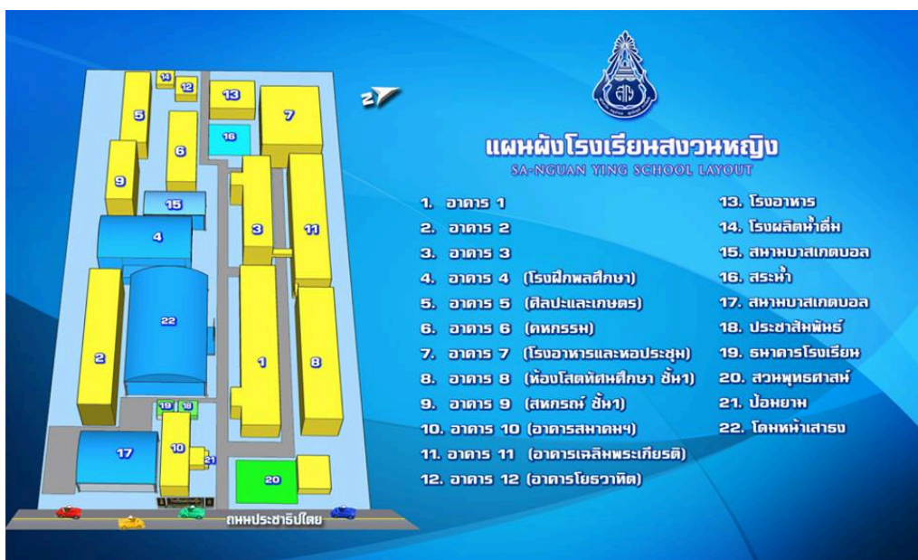
ภาพที่ 2 แสดงแผนผังโรงเรียนสวงวนหญิง