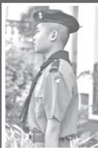
ด้านข้าง