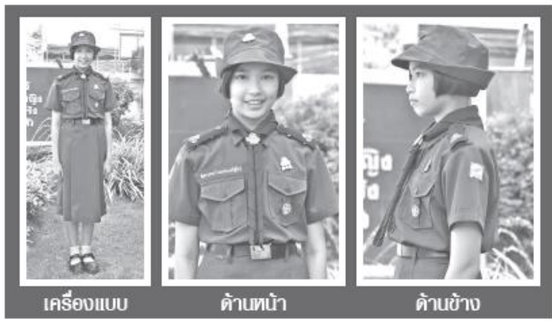
เครื่องแบบ