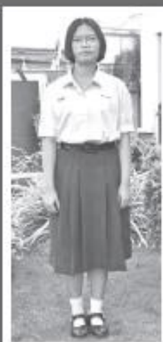
เครื่องแบบ