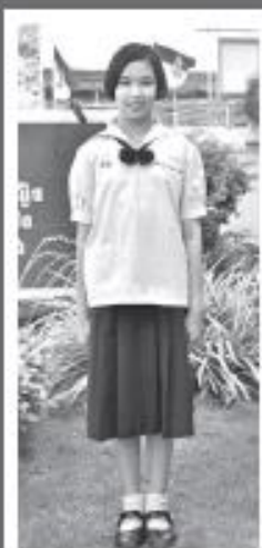
เครื่องแบบ