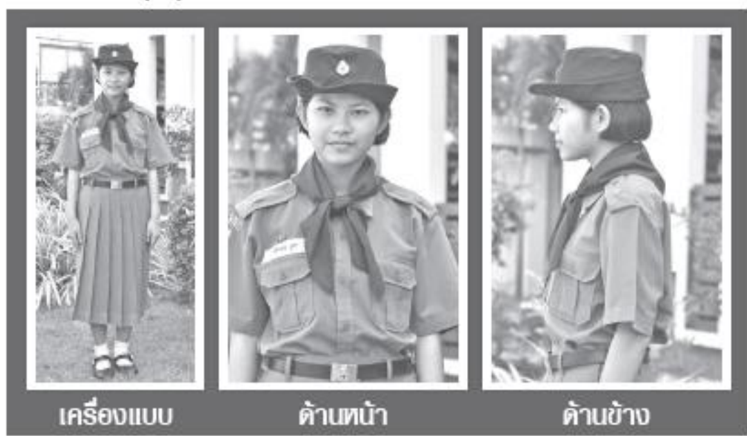
เครื่องแบบ