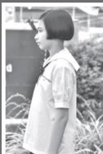
ด้านข้าง