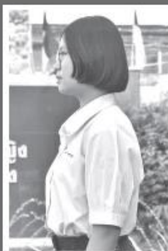
ด้านข้าง