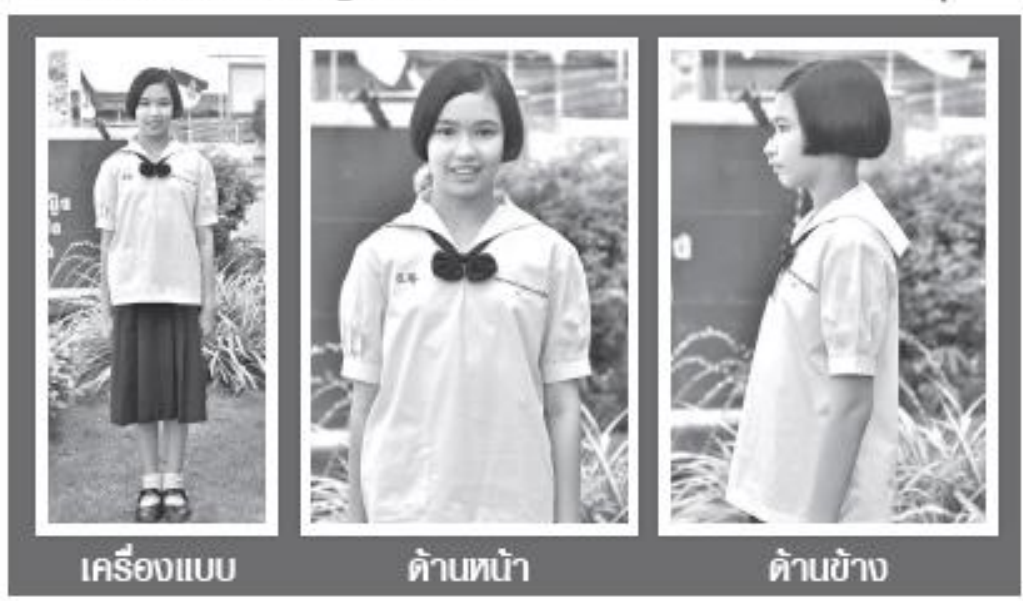
เครื่องแบบ