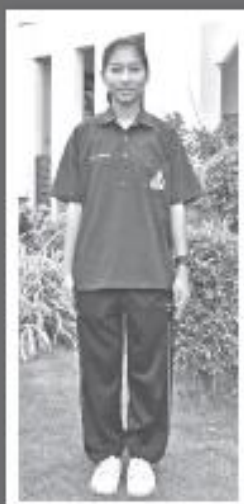
เครื่องแบบ