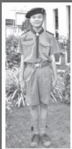
เครื่องแบบ