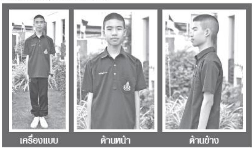
เครื่องแบบ