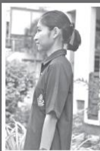
ด้านข้าง