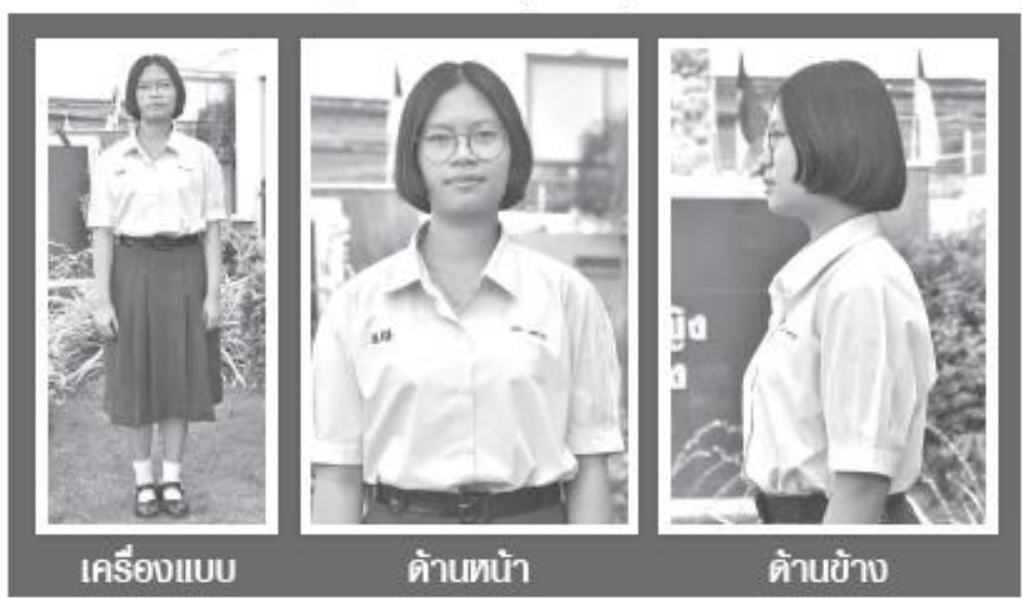
เครื่องแบบ