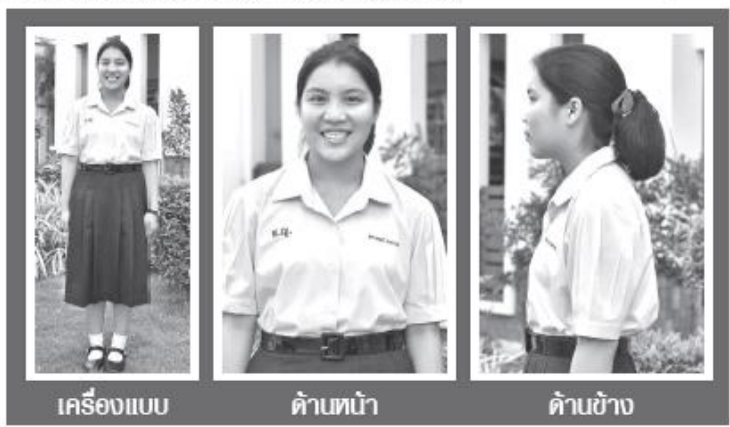
เครื่องแบบ