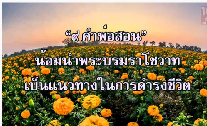
"๙ คำพ่อสอน" พระบรมราโชวาทในพระบาทสมเด็จพระเจ้าอยู่หัว รัชกาลที่ ๙ ที่ทรงพระราชทานแก่ พลสกนิกธนา

คำชี้แจง ให้นักเรียนดูคลิปวิดีโอต่อไปนี้